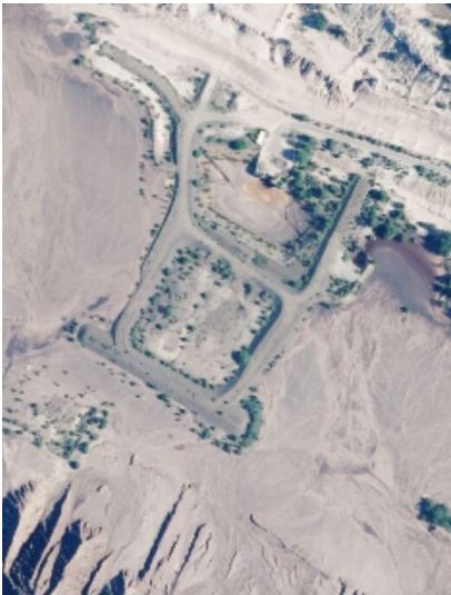
Auslaufbauwerk AEW im Tagebau Nochten