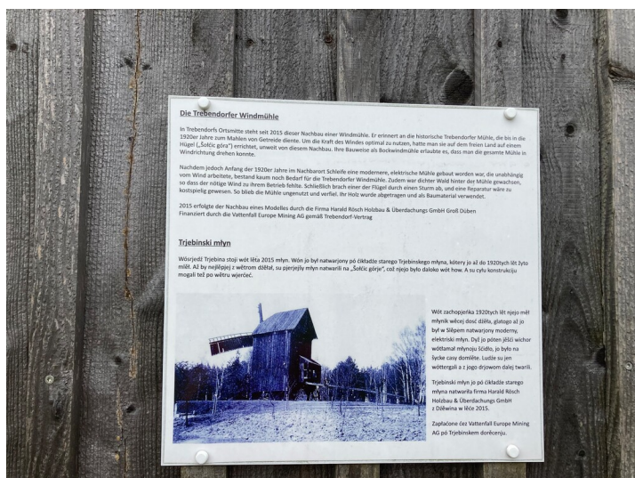
Informationstafel an der Windmühle Trebendorf