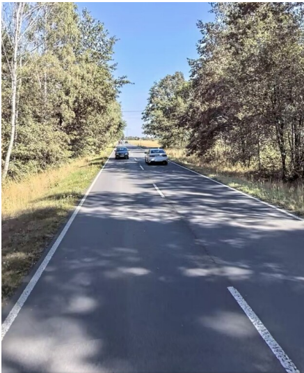
Umverlegung der Bundesstraße 156 bei Bluno