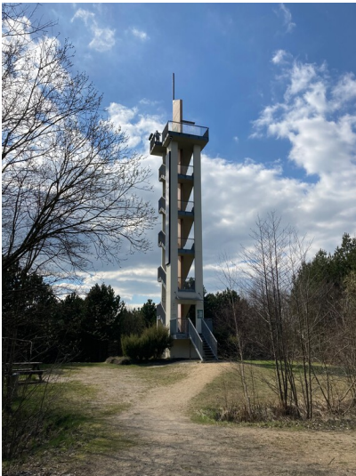
Aussichtsturm Neuberzdorfer Höhe