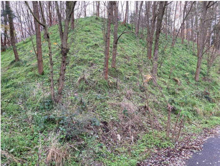
Deponie/Solarpark Südwest KW Boxberg