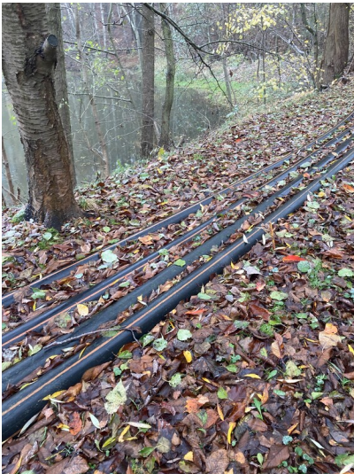
Buschbachzufluss Berzdorfer See