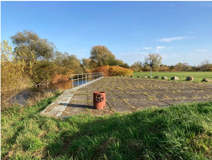
Flutungsanlage für den Berzdorfer See, Entnahmesseite an der Neiße