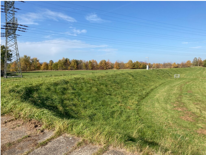
Hochwasserschutzdamm von Hagenwerder Richtung Norden