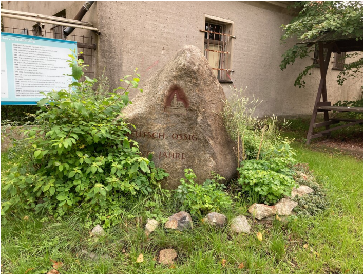
Gedenkstein für die Teildevastierung Deutsch Ossig