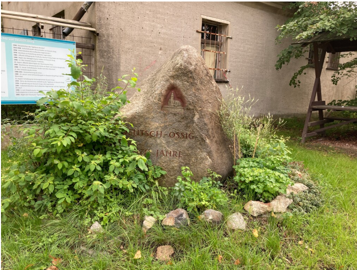
Gedenkstein für die Teildevastierung Deutsch Ossig