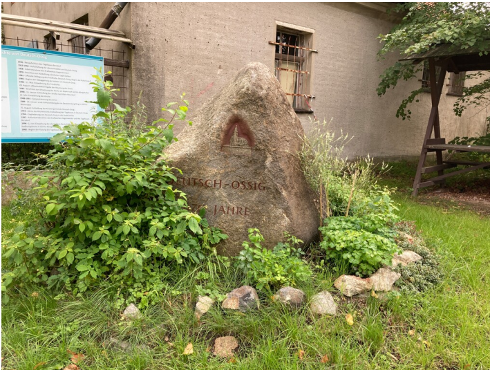
Gedenkstein für die Teildevastierung Deutsch Ossig