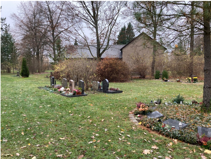
Friedhof Hagenwerder