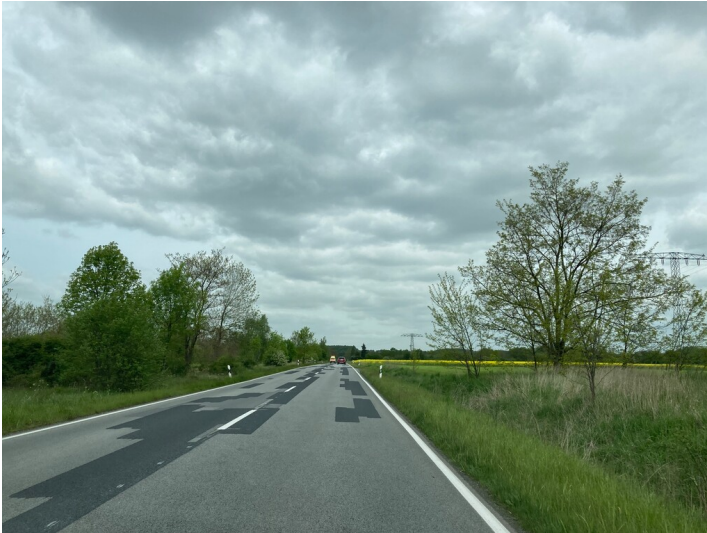
Verlegung der Bundesstraße 99 zwischen Görlitz und Hagenwerder