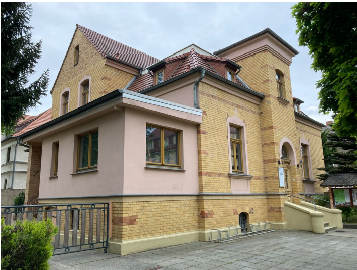
Villa des Glasfabrikanten Hirsch