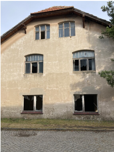
Schamottewerk Rietschen