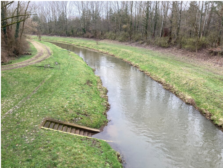
Umverlegung Hauptspreewasser bei Uhyst