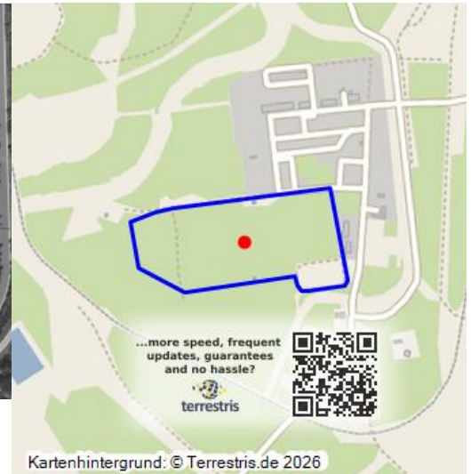
Montageplatz der Tagebaugroßgeräte des Tagebaus Reichwalde

Der südlich der Tagesanlagen freigeschnittene Platz wurde planiert und als Montageplatz für die Großgeräte verwendet, z. B. für den Bagger 1302 und für die Abraumförderbrücke F60. Das Gelände ist heute wieder fast vollständig bewaldet.