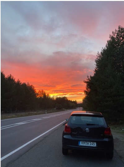
Umverlegung der Bundesstraße 156 aufgrund der Landinanspruchnahme durch den Tagebau Bärwalde