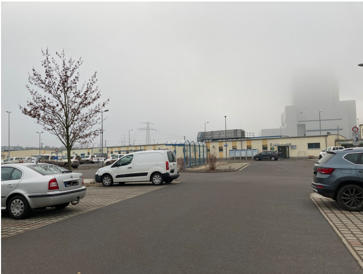
Waschkaue für den Tagebau Nochten/Reichwalde