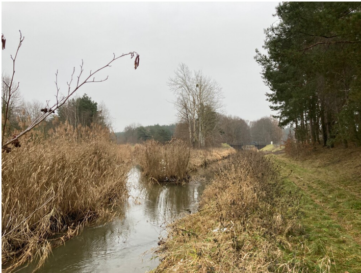
Schwarzer Schöps