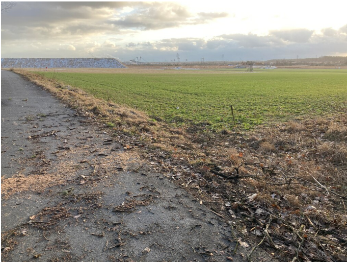
Immissionsschutzbauwerk Trebendorf