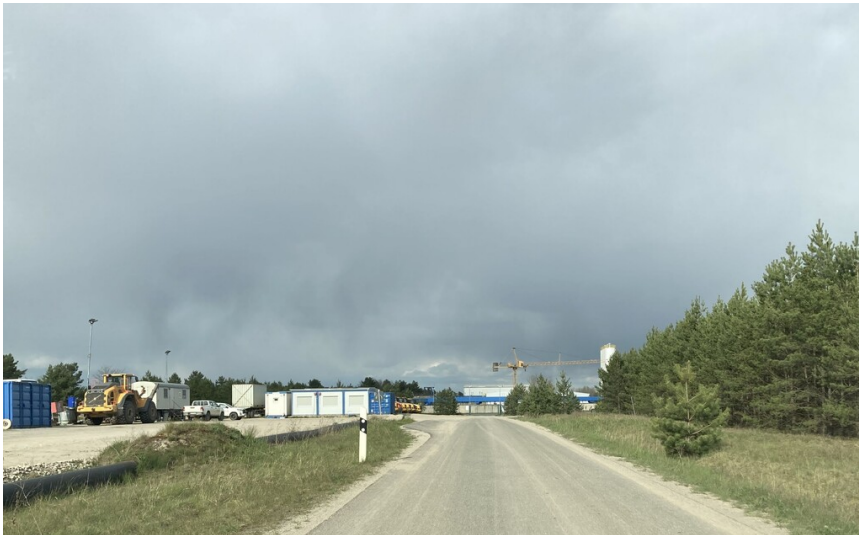
Grubenwasserreinigungssanlage Tzschelln