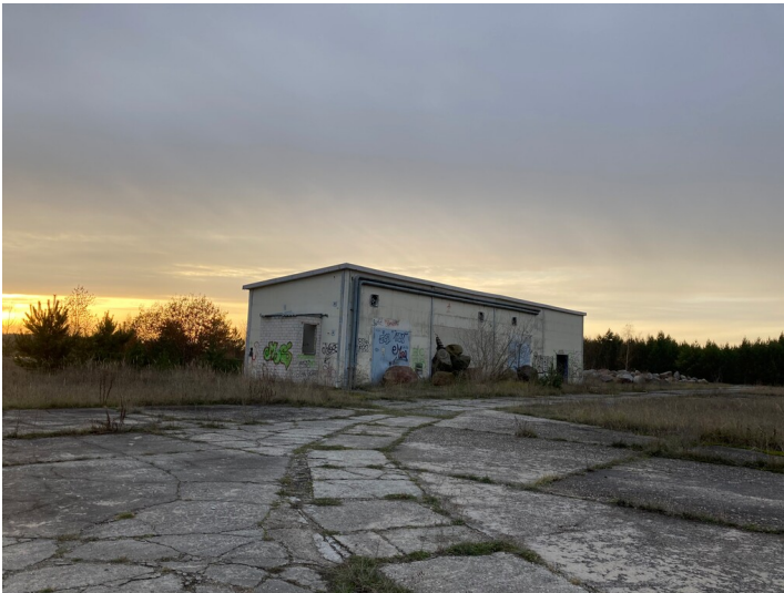
Tagesanlagen Tagebau Bärwalde