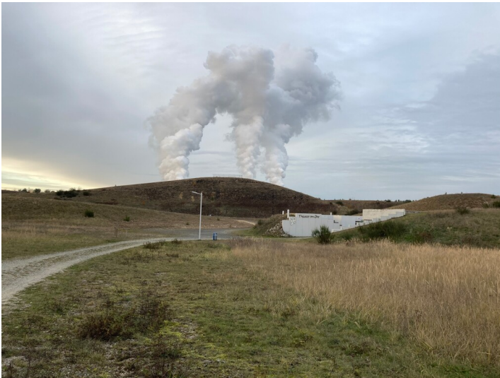
Landschaftsbauwerk ""Das Ohr""