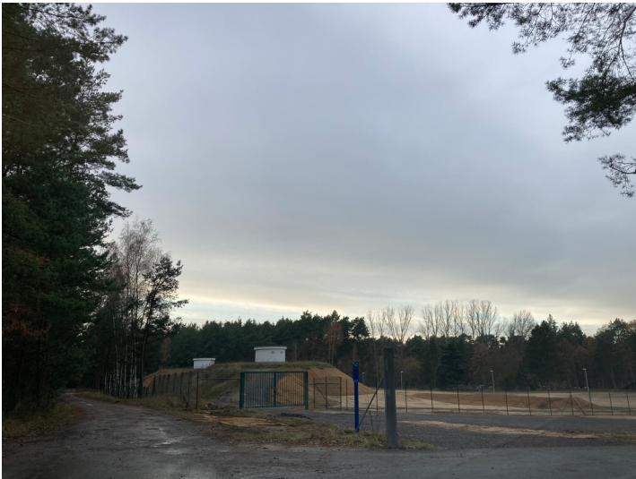
Wasserwerk Boxberg