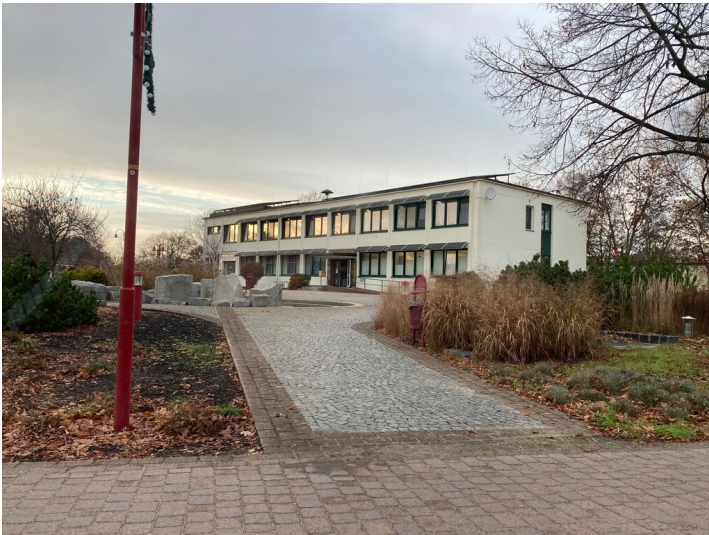
Ärztehaus der Werksiedlung Boxberg