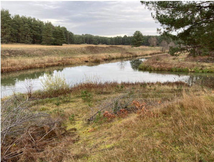
Renaturierung des Modergrabens - Einleitung des verlegten Teilstückes in den Altarm des Modergrabens