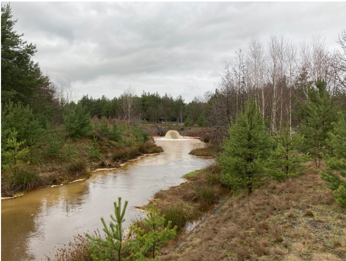
Grundwasserableiter parallel zur B156