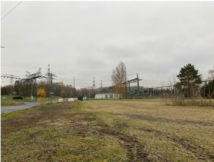
Umspannwerk Hagenwerder 110 kV

Schlagwörter: Umspannwerk Fachsicht(en): Denkmalpflege Gemeinde(n): Görlitz Kreis(e): Görlitz Bundesland: Sachsen