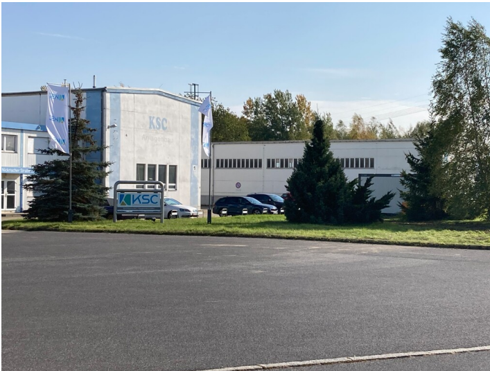
Kraftwerk Hagenwerder - Nebengebäude