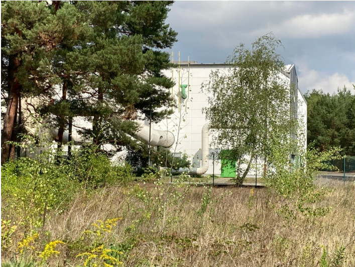
Fernwärmestation Zeißig