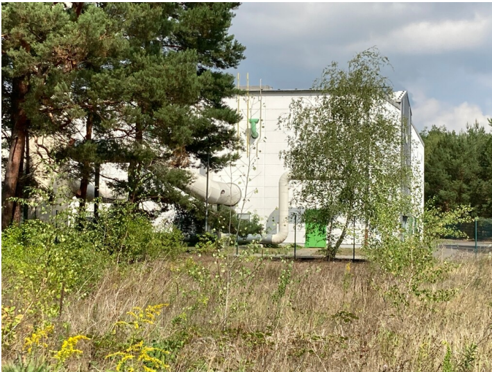
Fernwärmestation Zeißig