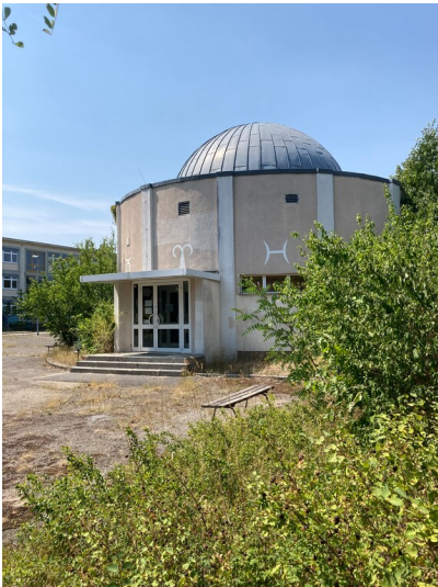
Planetarium Hoyerswerda