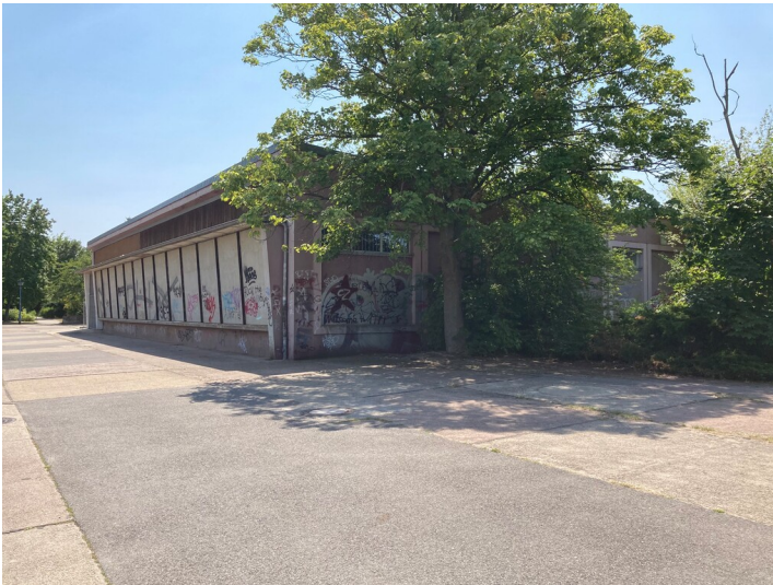
Versorgungszentrum des Wohnkomplex IV