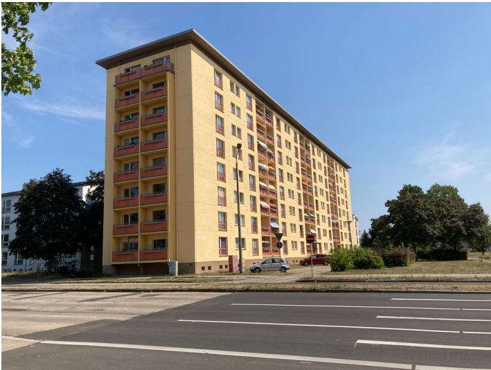
Wohnblock Bautzener Alle 53 - 59