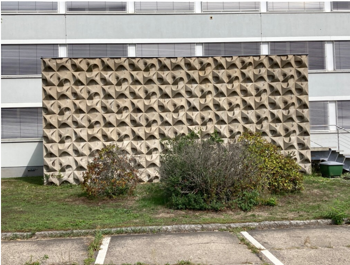
Rechenzentrum für das Gaskombinat Schwarze Pumpe

Schlagwörter: Bürogebäude Fachsicht(en): Denkmalpflege Gemeinde(n): Hoyerswerda Kreis(e): Bautzen Bundesland: Sachsen