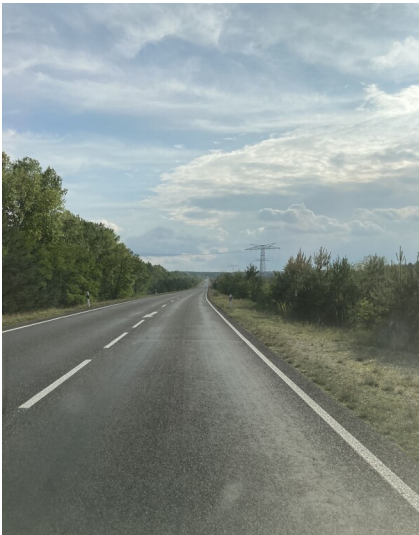
Umverlegung der Bundesstraße 97 um den Tagebau Spreetal