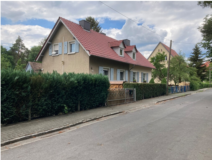
Werkssiedlung Heide - Doppelhaus