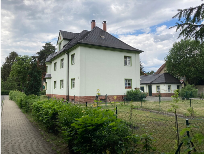
Wohnhaus Bahnhofstraße 30 der Werkssiedlung Heide