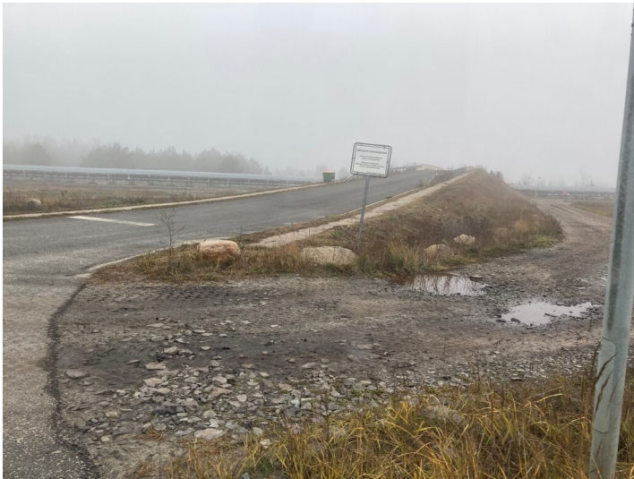
Panzermarschstraße des Truppenübungsplatzes Oberlausitz