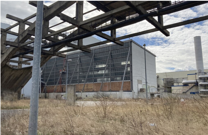
30-kV-Station der Rectisolanlage