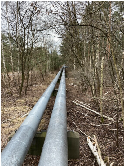
Fernwärmeleitung vom Kraftwerk Schwarze Pumpe nach Hoyerswerda