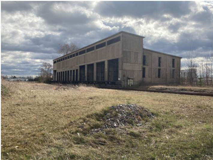
30 kV-Station Generatorenhaus