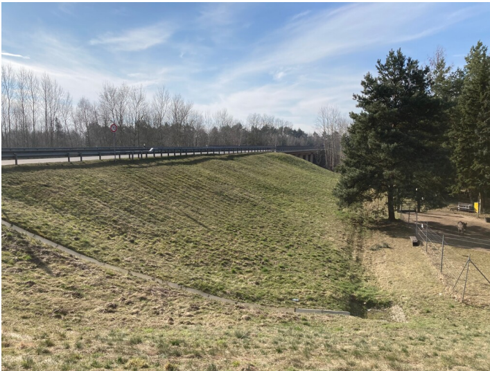
Umverlegung der B 156