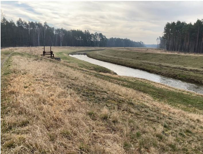
Umverlegung der Schwarzen Elster zwischen Neuwiese und Geierswalde