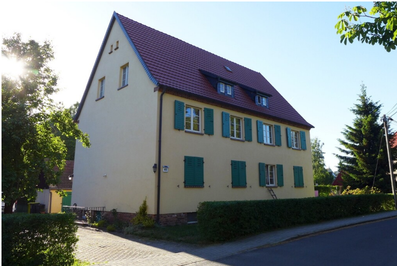
Wohnhaus der Werksiedlung Heide bei Wiednitz