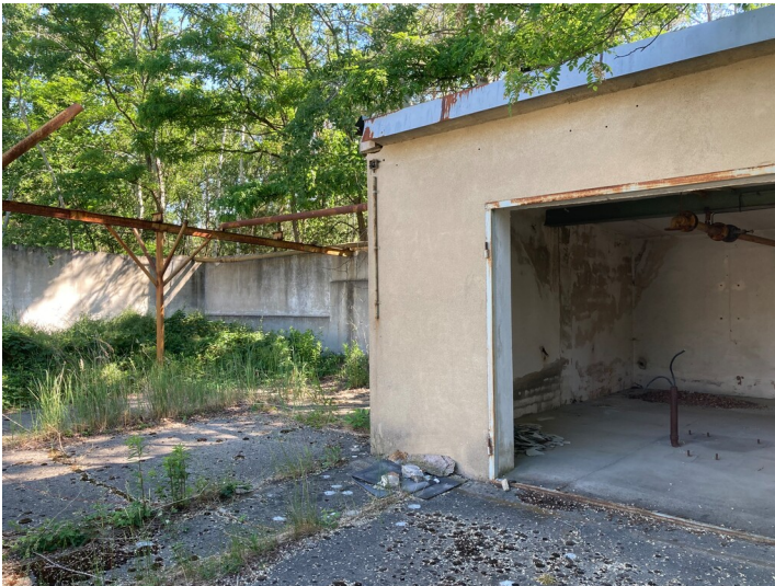
Betriebsgebäude der Brikettfabrik