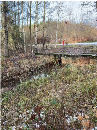
Rothwassergraben zur Ableitung des Grubenwassers