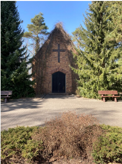
Friedhof Laubusch