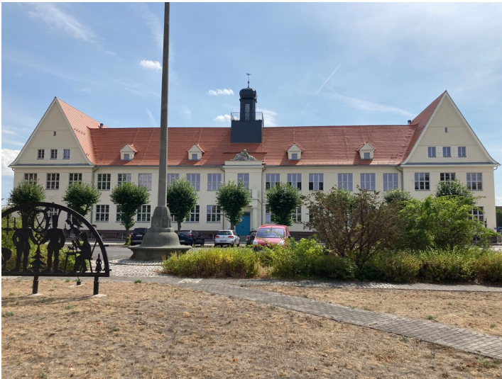
Schule der Kolonie Erika