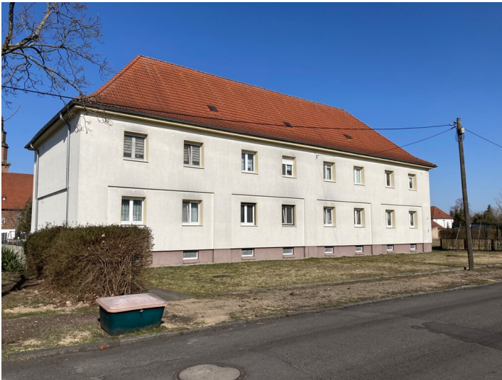
Wohnhaus Oststraße 13 der Kolonie Erika