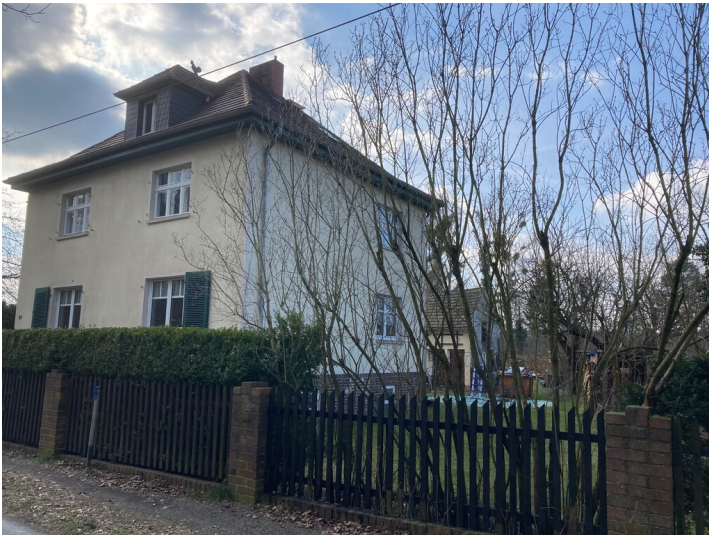
Wohnhaus Lauta-Nord, Weststraße 31

Schlagwörter: Wohnhaus Fachsicht(en): Denkmalpflege Gemeinde(n): Lauta Kreis(e): Bautzen Bundesland: Sachsen