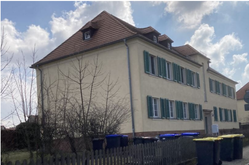
Teil der Objektgruppe Gartenstadtsiedlung Lauta Nord (30800141): Arbeiterwohnhaus